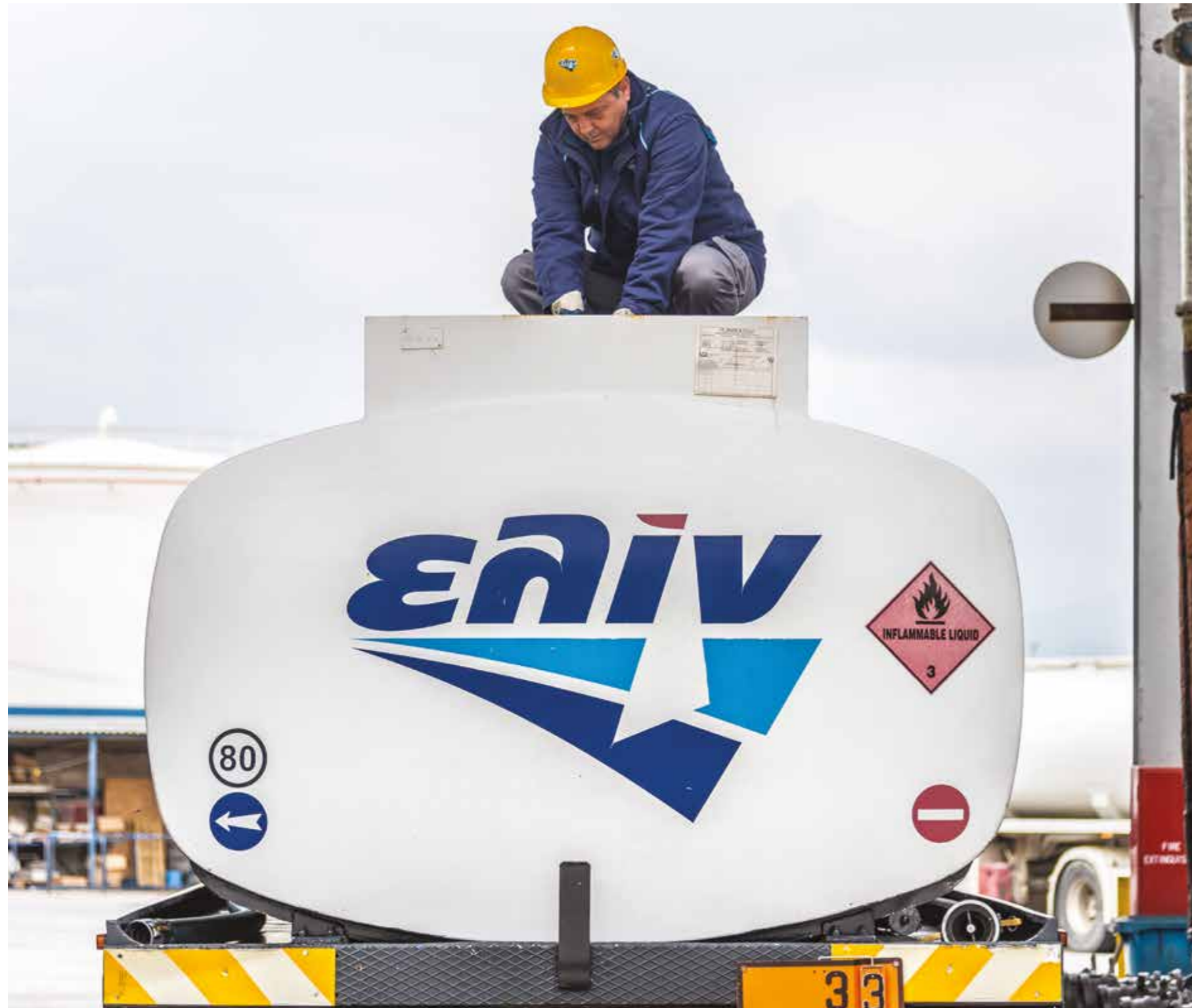
Άνθρωπος βασικός παράγοντας της ανάπτυξης της εταιρίας